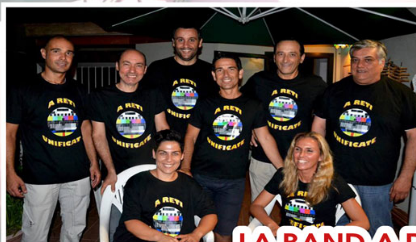
LA BAND A RETI UNIFICATE