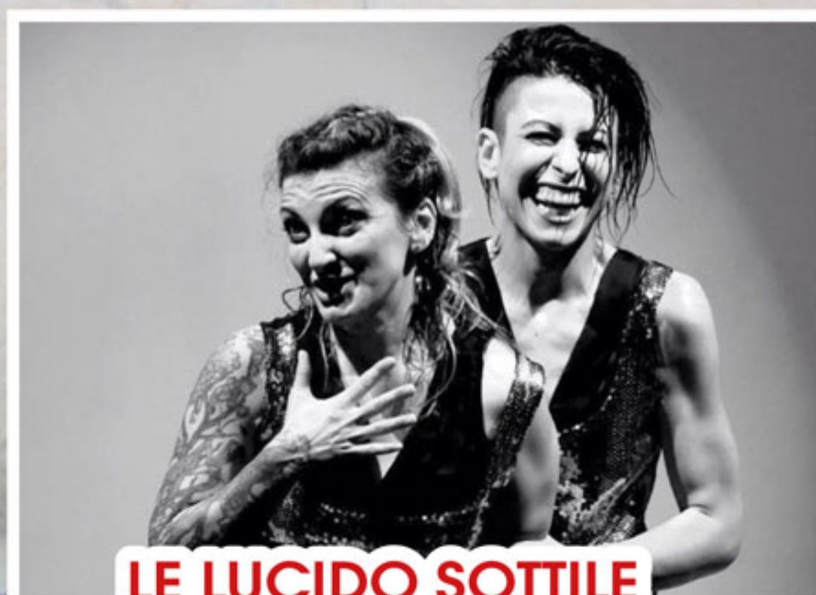
LE LUCIDO SOTTILE