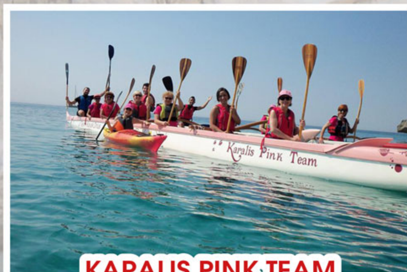
KARALIS PINK TEAM