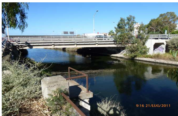
come è ...